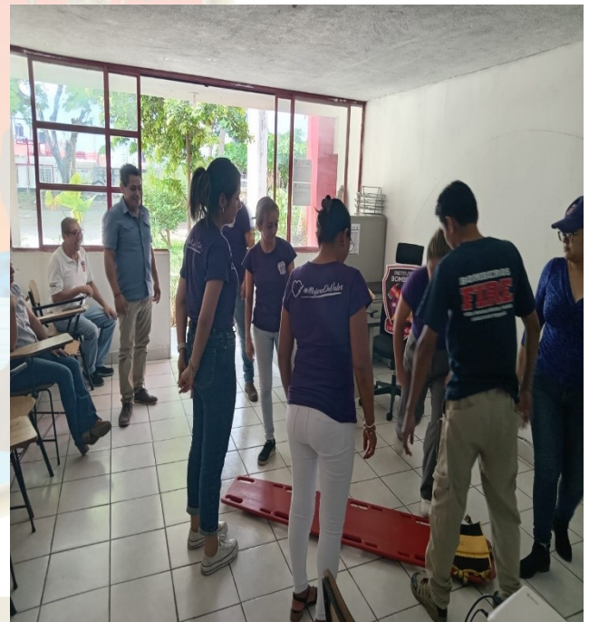
Personal recibiendo instrucciones para realizar la inmovilización y manejo de pacientes.