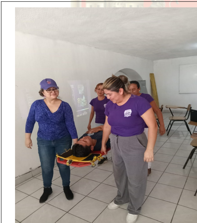
Personal femenino del IBECH realizando técnicas de inmovilización y manejo de pacientes.