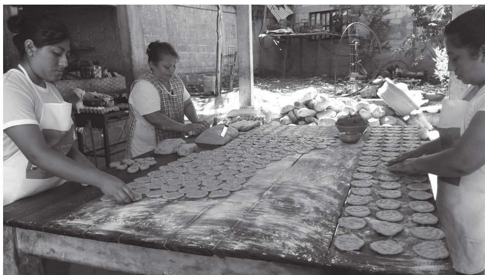
Imagen 1. Haciendo “el rico pan de Huitiupán”.